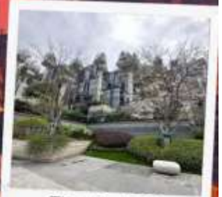
Tian An 1,000 Trees Square