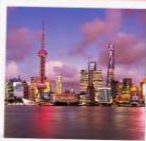
ขึ้นหอไข่มุก