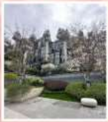
TIAN AN 1,000