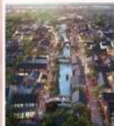
เมืองโบราณผาน หลงกู่เจี้ยน