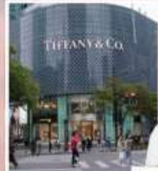
ถนนหวยไห้