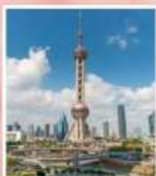
ชั้นชมหอไข่มุก