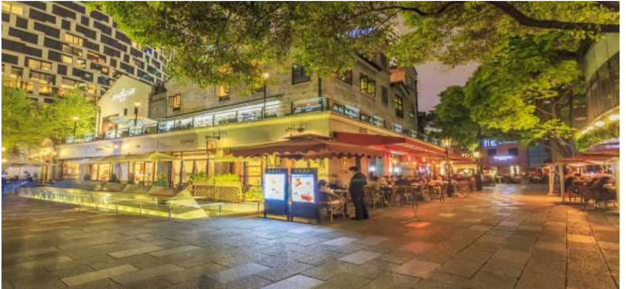
👉 พักที่ HOLIDAY INN EXPRESS SHANGHAI HOTEL หรือเทียบเท่าระดับ 4 ดาว

หลังอาหารค่ำนำท่านเที่ยวชม ซินเทียนตี้ ย่านฮิปเตอร์ใจกลางนครเซี่ยงไฮ้ ที่วัยรุ่นต้องมา กลายเป็นสถานที่ท่องเที่ยวติดอันดับต้นๆไปแล้ว สำหรับแหล่งช้อปปิ้งแห่งนี้ ไม่แพ้แหล่งช้อปปิ้งรุ่นพี่ อย่าง ถนนนานกิง ถนนคู่เจียง Yu Yuan Bazaar ถือว่าเป็นอีก 1 ไฮไลท์เด็ดของนครแห่งนี้ เนื่องจากเอกลักษณ์ที่ไม่เหมือนใคร สิ่งปลูกสร้างที่ใช้วัสดุบล็อกแบบสถาปัตยกรรมแบบ Shikumen (ซิกเหมิน) การผสมผสานระหว่างสถาปัตยกรรมตะวันตกกับจีนเข้าด้วยกัน ทางเดินหิน กำแพงหิน ประตูหิน บ้านเมืองเก่าแต่ดูแลรักษาอย่างดี และอีก 1 ไฮไลท์ที่ห้ามพลาด ร้านเสื้อแบรนด์เนมเกาหลีสุดไวรัล MARDI MERCREDI SHOP มาเปิดช้อปปิ้งแรกในเมืองเซี่ยงไฮ้ ให้ท่านเลือกซื้อตามอัธยาศัย และยังมีร้านรองเท้าแบรนด์ดังต่างๆมากมาย เช่น ON CLOUD FLAGSHIP STORE