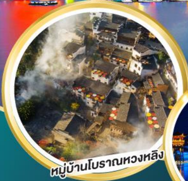
หมู่บ้านโบราณหวงหลิง