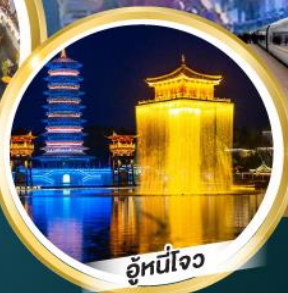
อู่หนี่โจว