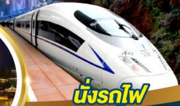
นั่งรถไฟ ความเร็วสูง