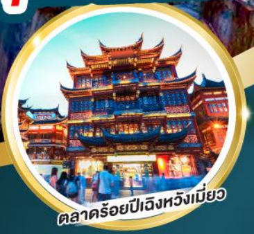
ตลาดร้อยปีเจิ้งหวงเหมี่ยว