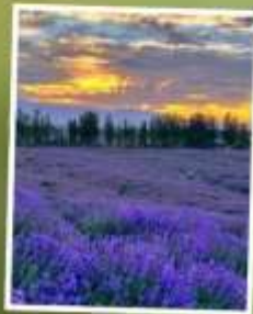
ทุ่งดอกลาเวนเดอร์