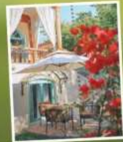
หมู่บ้านคางจันฉี