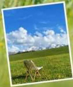
ทุ่งหญ้านาราตี