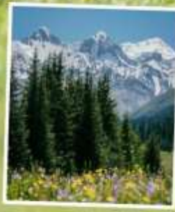
ทุ่งหญ้าคาลาจูน