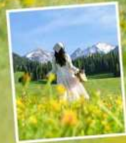
ทุ่งหญ้าแห่งท้องฟ้า