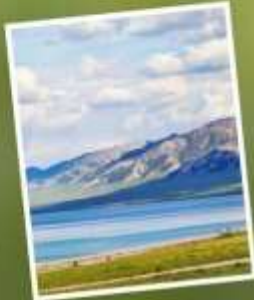
ทะเลสาบโซหลี่มู่