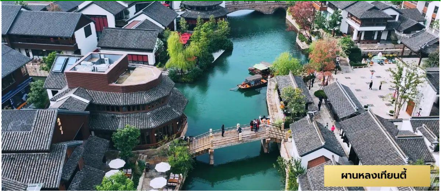
ผานหลงเทียนตี้

เช้า 10 | รับประทานอาหารเช้า ณ ห้องอาหารโรงแรม