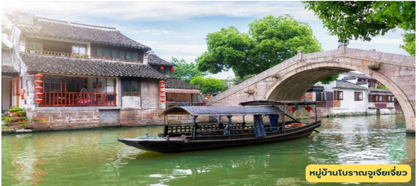
หมู่บ้านโบราณจูเจียเจียว