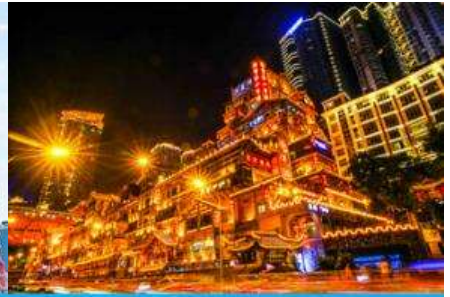
ย่านหงหยาดัง