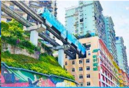
รถไฟวิงทะเลติก