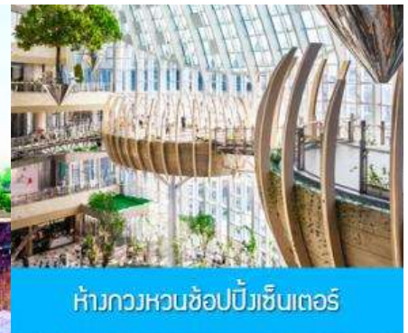
ห้างกวงหวนช้อปปิ้งเซ็นเตอร์

วันที่ 11 เมืองจงชิ่ง-เมืองโบราณฉือชิว-กวงหวนช้อปปิ้งคอมเพล็กซ์ –บินกลับกรุงเทพฯ (ดอนเมือง)