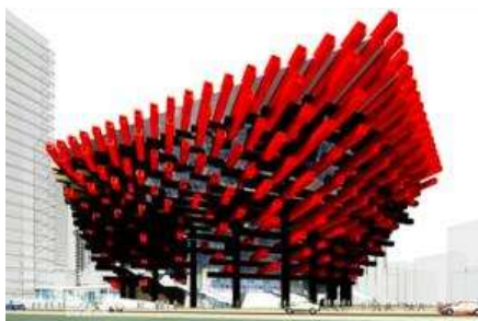
หอศิลป์กั๋วไท่ (อาคารตะเกียบ)