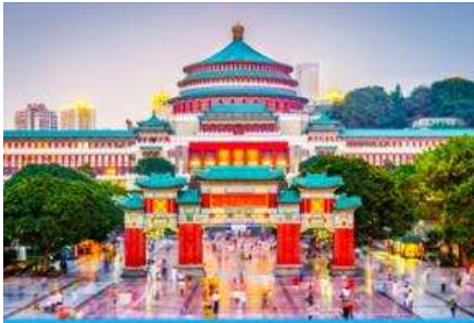
ศาลาประชาม