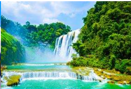
น้ำตกเต๋อเทียน