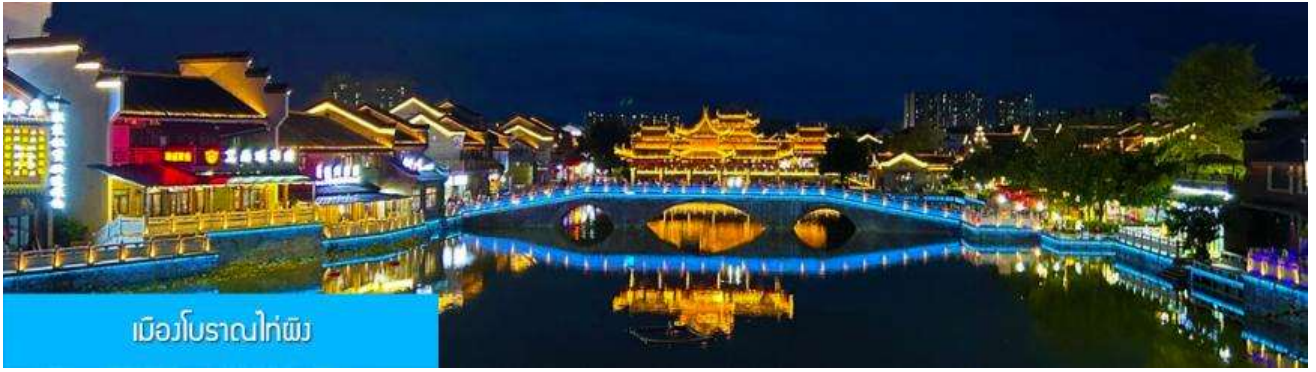
เมืองโบราณไค่ผิง