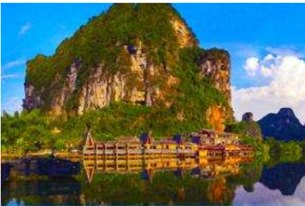
อุทยานหมิงชื้อ

พักที่ MINGSHI YISHU HOTEL ระดับ 3 ดาวท้องถิ่นหรือเทียบเท่าในอุทยานหมิงชื้อ