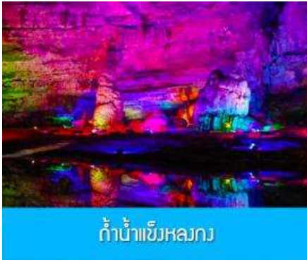
ถ้ำน้ำแข็งหลวง