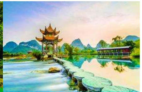
สวนน้ำฟู่อววน

วันที่สาม อุทยานหมิงชื้อ – น้ำตกเต๋อเทียน – สวนน้ำฟู่อววน (เอ้อฉวน) เมืองจิ้งซี - เมืองโบราณจิ้นชิว