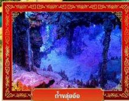
ถ้ำลู่อ้อ