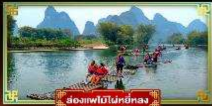
ล่องแพไม้ไผ่หยี่หลง