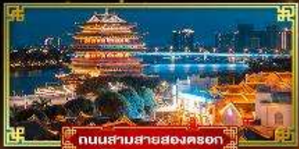
ถนนสามสายสองครอก