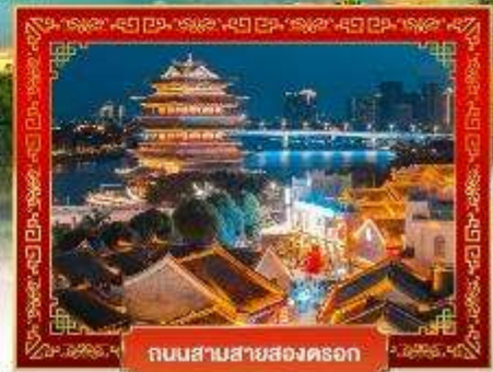
ถนนสามสายสองตึก