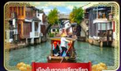
เมืองโบราณอูเจียวเจียว