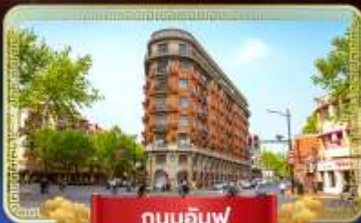
ถนนอันฟู่