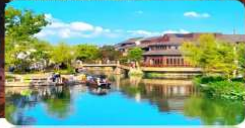
เมืองโบราณผานหลง