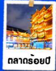
ตลาดร้อยปี