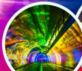
อุโมงค์เลเซอร์