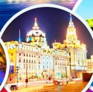
เดอะบันด์