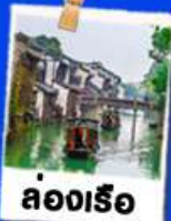
ล่องเรือ