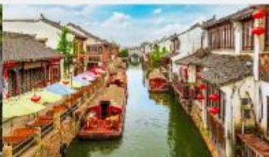
ถนนโบราณซานตงเจีย

*ทางบริษัทฯ ขอสงวนสิทธิ์ในการสลับโปรแกรมทัวร์ตามความเหมาะสมขึ้นอยู่กับสถานการณ์หน้างาน โดยคำนึงถึงผลประโยชน์ของลูกค้าเป็นสำคัญ