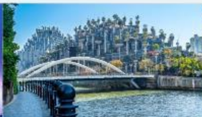
TIAN AN 1000 TREES