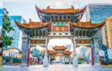
ประตูน้ำทอง ไถ่หยก

*ทางบริษัทฯ ขอสงวนสิทธิ์ในการสลับโปรแกรมทัวร์ตามความเหมาะสมขึ้นอยู่กับสถานการณ์หน้างาน โดยคำนึงถึงผลประโยชน์ของลูกค้าเป็นสำคัญ