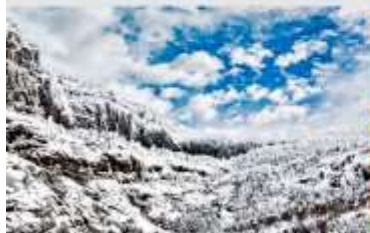
ภูเขาหิมะเจียวจื่อ