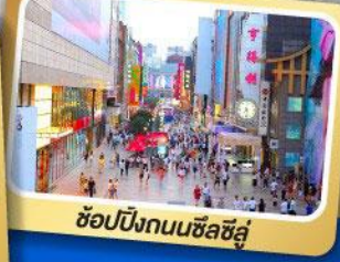
ช้อปปิ้งถนนซื่อซื่อ