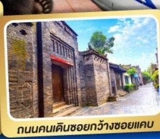
ถนนคนเดินชอยกวางชอยแคบ