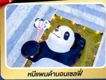
หมีแพนด้าออนเซล์ฟี