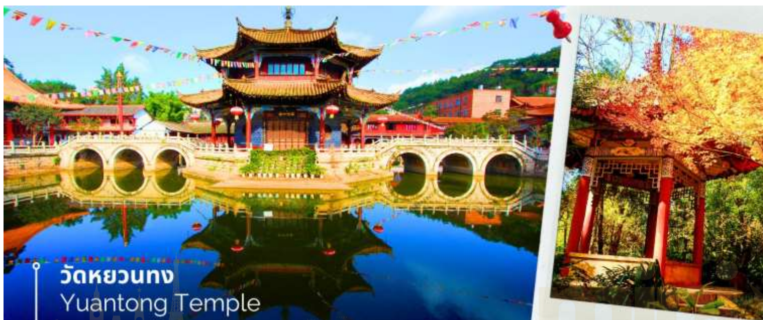
วัดหยวนทง Yuantong Temple

นำท่านชม วัดหยวนทง (Yuantong Temple) วัดแห่งนี้เป็นวัดที่ใหญ่และเก่าแก่ที่สุดในเมืองคุนหมิง สร้างมาตั้งแต่สมัยราชวงศ์ถัง มีอายุยาวนานประมาณ 1,200 กว่าปี การสร้างวัดแห่งนี้จะแปลกตากว่าวัดอื่นในจีน เพราะปกติแล้วการสร้างวัดของจีนส่วนมากจะต้องสร้างอยู่บนภูเขา แต่วัดหยวนทงสร้างวัดต่ำกว่าภูเขา โดยวิหารจะอยู่ต่ำที่สุด เนื่องจากวัดแห่งนี้ไม่ได้สร้างขึ้นเพื่อเป็นวัดโดยตรง แต่เคยเป็นศาลเจ้าแม่กวนอิมมาก่อน