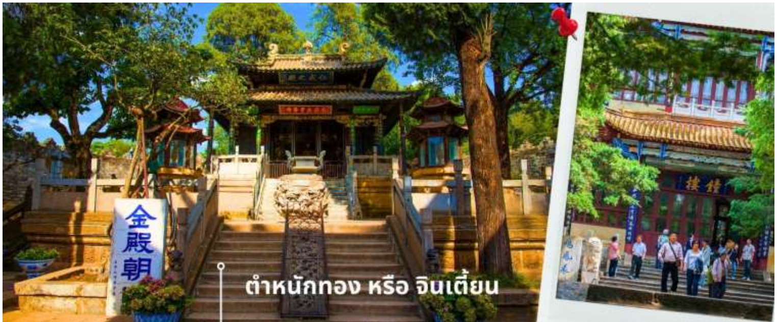
ต้าหนังกทง หรือ จินเตี้ยน

นำท่านเยี่ยมชม ต้าหนังกทง หรือ จินเตี้ยน (The Golden Temple Park | Jindian park) (ไม่รวมค่ารถแบตเตอรี่ 10 หยวน/ท่าน) โบราณสถานสำคัญของมณฑลยูนนาน ที่ได้รับการปกป้องดูแลโดยรัฐบาลจีน ตั้งอยู่บริเวณเชิงเขาหมิงเฟิง ล้อมรอบด้วยแนวกำแพงและหอคอยเหมือนเป็นป้อมปราการ ต้าหนังกทงถูกเรียกตามลักษณะอาคารที่มีสีทองอร่าม จากทองเหลืองในส่วนของผนังและหลังคา รวมกว่า 200 ตัน โดยถือเป็นสิ่งปลูกสร้างสัมฤทธิ์ที่ใหญ่ที่สุดของจีน ภายในมีรูปปั้นทองโดยมีเงินอยู่ (เสวียนอู่) เทพเจ้าลัทธิเต๋าเป็นองค์ประธาน