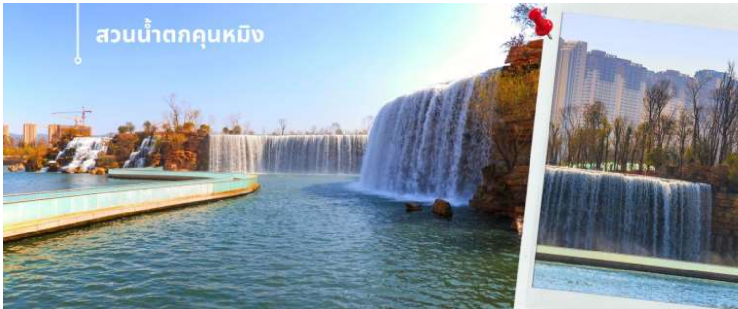
สวนน้ำตกคุนหมิง

นำท่านเดินทางสู่ สวนน้ำตกคุนหมิง เป็นสวนสาธารณะใจกลางเมืองคุนหมิง ถือเป็นสถานที่ท่องเที่ยวแห่งใหม่ และเป็นที่พักผ่อนหย่อนใจยอดฮิตของชาวเมืองคุนหมิง ที่สร้างขึ้นด้วยฝีมือมนุษย์ น้ำตกแห่งนี้เป็นส่วนหนึ่งของโครงการผันน้ำจากแม่น้ำหุ่ยหลาน ให้เข้าสู่ทะเลสาบเตียนซี น้ำตกแห่งนี้มีความสูง 12.5 เมตร ยาว 400 เมตร ใช้เวลาสร้างเกือบ 3 ปี