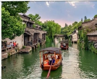
เมืองโบราณอูเจิ้น