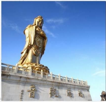
เกาะผู้ไถวซาน