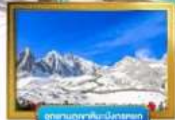
อุทยานภูเขาหิมะมังกรหยก

เดินทางโดยสารการบินจีนนำอิสเทิร์นแอร์ไลน์