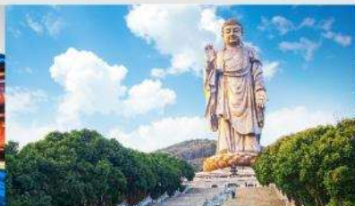
พระใหญ่หลิงชานต้าฝอ