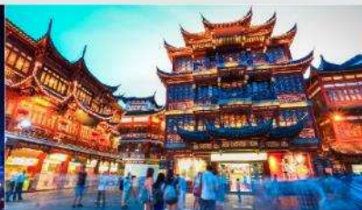
ตลาดร้อยปีเงินหวังเมี่ยว