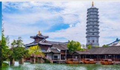
เมืองโบราณ PUYUAN

*ทางบริษัทฯ ขอสงวนสิทธิ์ในการลုပ်โปรแกรมทัวร์ตามความเหมาะสมขึ้นอยู่กับสถานการณ์หน้างาน โดยค่านั่งถึงผลประโยชน์ของลูกค้าเป็นสำคัญ