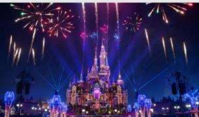
เซี่ยงไฮ้ดิสนีย์แลนด์