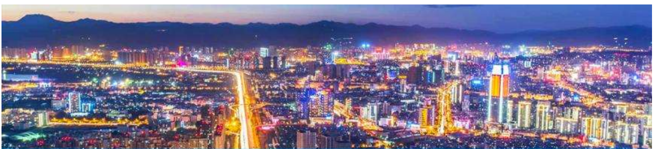
นครคุนหมิง