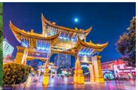
ถนนคนเดินหนานผิงเจีย