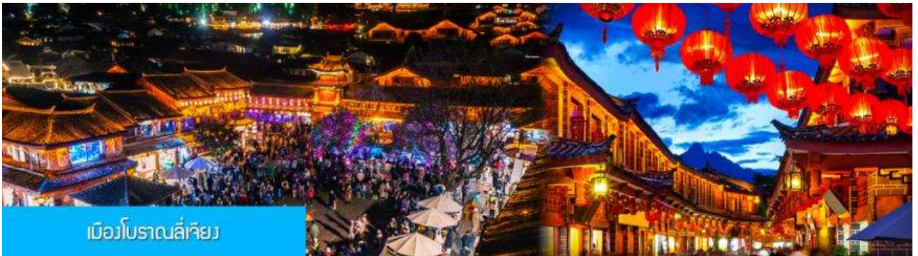
เมืองโบราณลี่เจียง