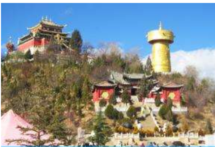
วัดลามะชวงจ้านหลิง

พักที่ SHU JIN MU YUN HOTEL ระดับ 4 ดาวท้องถิ่นหรือเทียบเท่าใน เมืองเซงกรีล่า