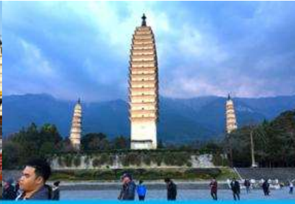
เจดีย์สามองค์