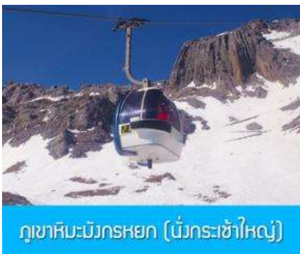
ภูเขาหิมะมังกรหยก (มังกรห้าใหญ่)

พักที่ FENGHUNG YANGSHENG HOTEL ระดับ 4 ดาวห้องถ้ำหรือเทียบเท่าใน เมืองลี่เจียง