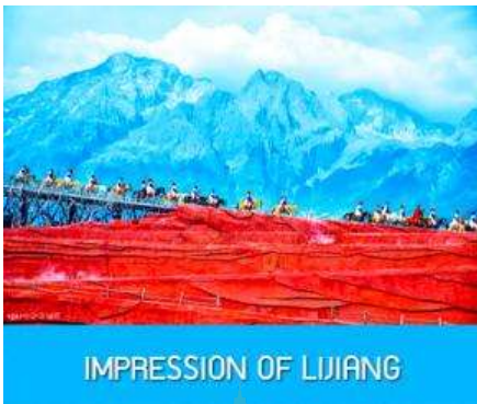
IMPRESSION OF LIJIANG