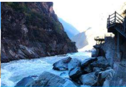
ช่องแคบเสือกระโจน