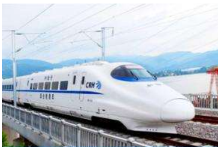
นั่งรถไฟความเร็วสูง

พักที่ FENGHUNG YANGSHENG HOTEL ระดับ 4 ดาวท้องถิ่นหรือเทียบเท่าใน เมืองลี่เจียง