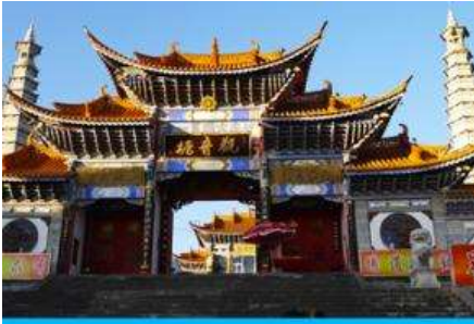
วัดเจ้าแม่กวนอิมเปลวกาย