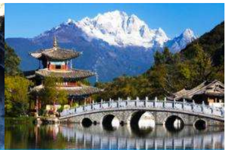
สะพานมังกรดำ

วันที่สาม เมืองเซงกรีล่า-วัดชวงจ้านหลิง-ช่องแคบเสือกระโจน-เมืองลี่เจียง-สะพานมังกรดำ-เมืองโบราณลี่เจียง