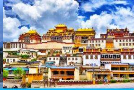
เมืองเซวกริล่า

วันที่สอง เมืองโบราณต้าหลี่-วัดเจ้าแม่กวนอิมเปลวกาย- ผ่านชมเจดีย์สามองค์- เดินทางสู่เมืองเซวกริล่า-เมืองโบราณเซวกริล่า