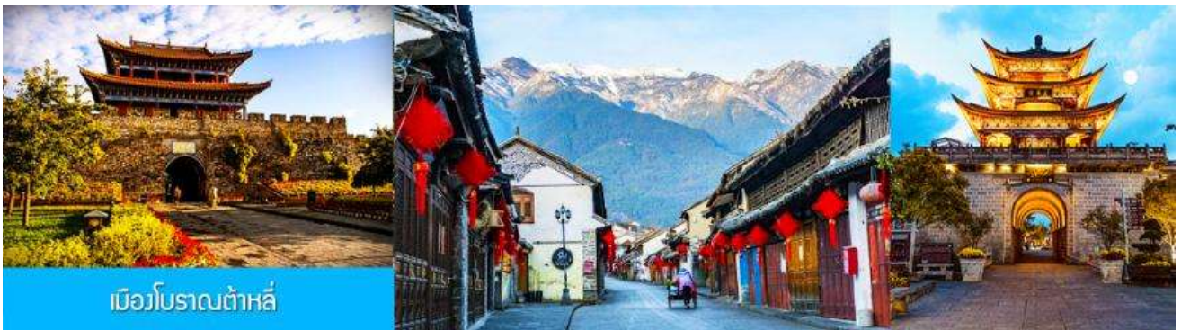
เมืองโบราณต้าหลี่