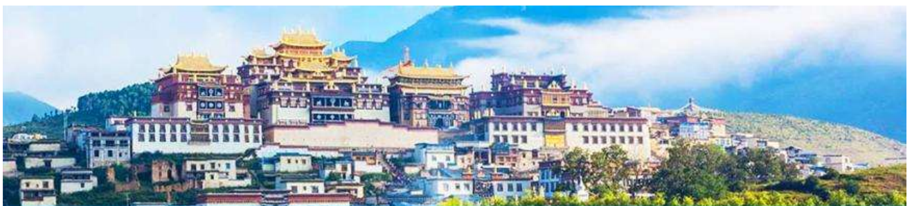
เมืองโบราณเซวกริล่า