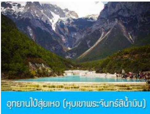
อุทยานไป๋สู่ยเหอ (หุบเขาพระจันทร์สีน้ำเงิน)

หมายเหตุ กรณีที่กระเช้าขึ้นภูเขาหิมะมังกรหยกปิดให้บริการ ด้วยเหตุที่สภาพอากาศไม่เอื้ออำนวย หรือเป็นการปิดเพื่อตรวจสอบสภาพและซ่อมแซมประจำปี ทางทัวร์ขอสงวนสิทธิ์ที่จะจัดโปรแกรมขึ้นกระเช้า ที่จุดชมวิวภูเขาหิมะมังกรหยก ณ สถานีกระเช้าหุยุนซานผิงแทน