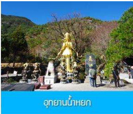
อุทยานน้ำหยก

***โปรดทราบ การแสดงนี้จัดขึ้นบริเวณลานกลางแจ้ง หากมีการงดการแสดงในวันนั้นๆ ไม่ว่าจะด้วยสภาพอากาศหรือกรณีอื่นใด ทำให้ไม่สามารถชมการแสดงได้ ผู้จัดสามารถจัดโชว์พื้นเมืองชุดอื่นมาทดแทนให้ท่านนั้น โดยไม่มีการคืนค่าบริการใดๆ ทั้งสิ้น ***