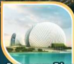
โรงละครหอยโข่งมุก