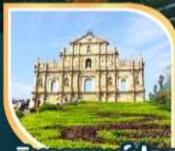
วิหารเซนต์ปอล