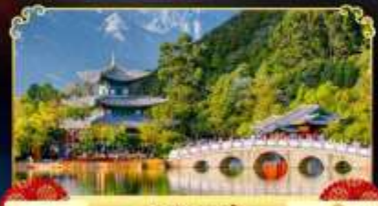
สระมิงกรต้า