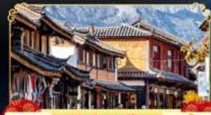
เมืองโบราณไปซา