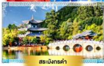
สระม้งกรต้า