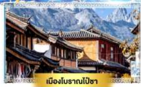
เมืองโบราณไปซา