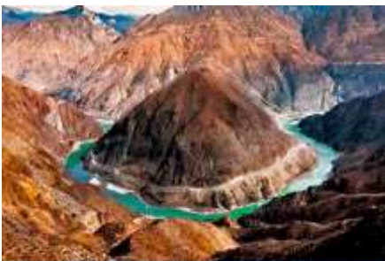
โค้งแรกของแม่น้ำจิบชาเจียง

พักที่ PHOENIX HOTEL โรงแรมระดับ 4 ดาวท้องถิ่น หรือเทียบเท่าในเมืองเซงกรีล่า