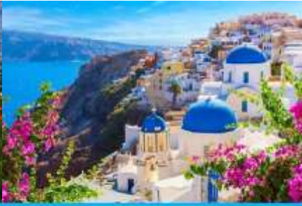
ย่านซานโตรินี่