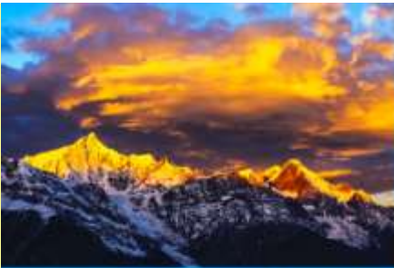
ภูเขาหิมะเหมยหลี่

หลังอาหารเช้าท่านเข้าสู่โรงแรมที่พักในเมืองเต๋อซัน ให้ท่านพักผ่อนหรือเดินเล่นถ่ายภาพในเมืองตามอัชฌาศัย