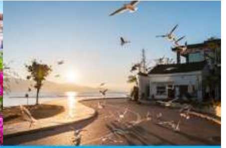
ย่านชายหาดรูป S