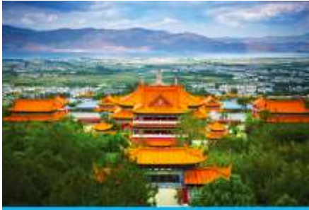
เมืองต้าหลี่