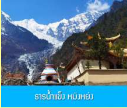
ธารน้ำแข็ง หมิงหย่ง