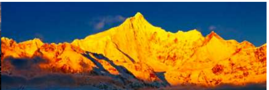
จุดชมวิว ภูเขาหิมะ