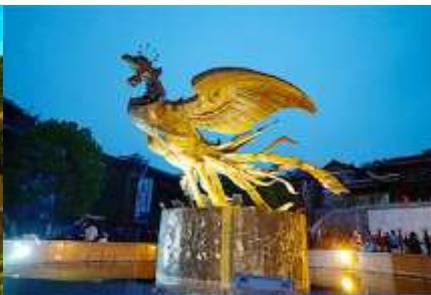
เมืองโบราณเฟิงหวง