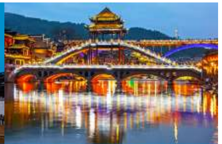
สะพานหงเจียว