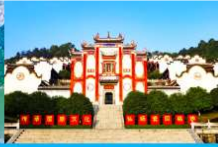
บ้านเกิดกวี ขิวหยวน