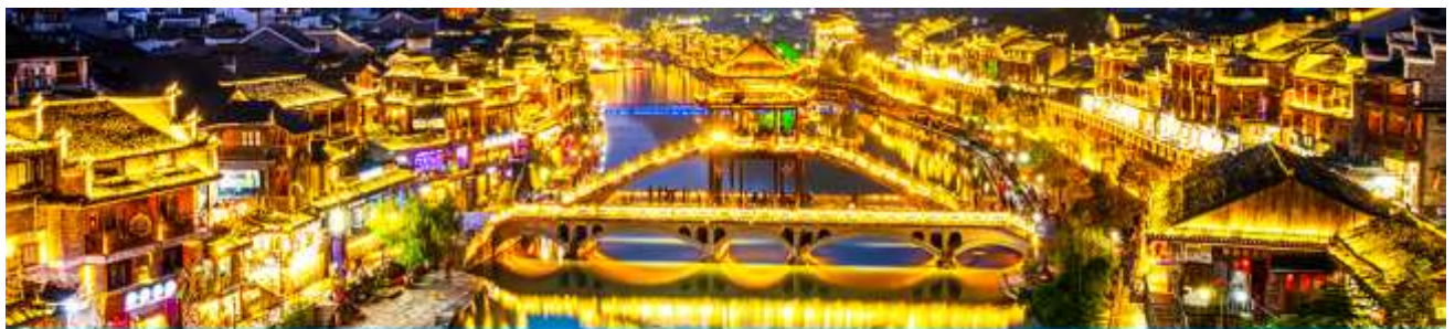
เมืองโบราณฟงหวง

จากนั้นนำท่านเดินทางสู่ เมืองโบราณฟงหวง (เมืองหงส์) 凤凰古城 ใช้เวลาเดินทางประมาณ 2 ชั่วโมง เมืองนี้ตั้งอยู่ในเขตปกครองตนเองของชนเผ่าตู่เจีย ตั้งอยู่ริมแม่น้ำถั่วเจียงทางทิศตะวันตกของมณฑลหูหนาน ล้อมรอบด้วยภูเขาเสมือนด่านช่องแคบภูเขาฟงหวง ตั้งเด่นตระหง่านเสมือนป้อมปราการ ธารน้ำถั่วเจียงใสสะอาดราวน้ำบริสุทธิ์ที่ถูกกั้นกกรองจนมองเห็นก้นลำธาร ชุมชนที่เป็นบ้านเรือนจีนโบราณแบบยกพื้นสูงเรียงรายกันริมแม่น้ำ ช่างเป็นทัศนียภาพที่สวยงามมีเสน่ห์ของเมือง โบราณฟงหวง ราวกับดินแดนมนุษย์ที่สร้างอยู่บนสวรรค์.. *** นำท่านนั่งรถเมล์ของเมืองโบราณฟงหวงเข้าสู่โรงแรมในเมืองเก่า * กระเป๋าสัมภาระรวมค่าพนักงานขนจากรถบัสไปโรงแรมแล้ว