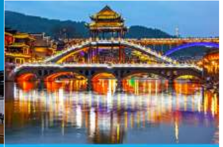
สะพานหงเจียว