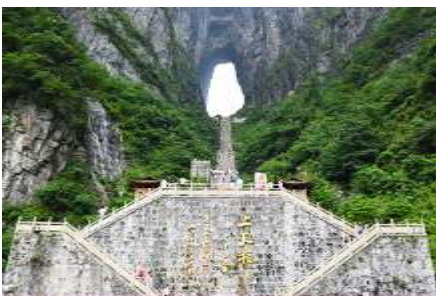
ประตูดาวรร์ค