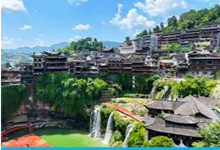
เมืองโบราณฝูหรงจิน