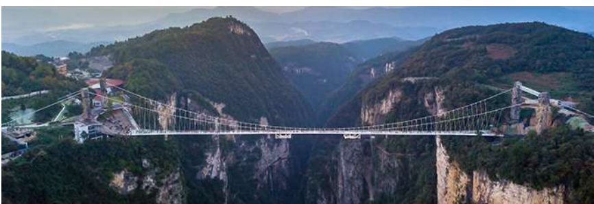
สะพานกระจกจางเจียเจี๋ย

พักที่ GUIYUANZHENPIN HOTEL โรงแรมระดับ 4 ดาวหรือเทียบเท่า