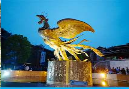
เมืองโบราณฟ่งหวง