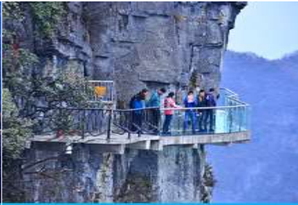
หน้าผาลอยฟ้าทางเดินกระจก