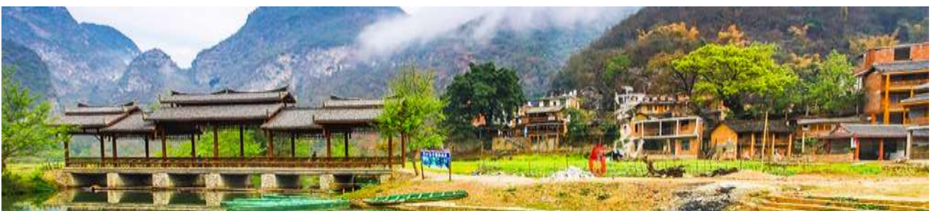
สวนดอกท้อ