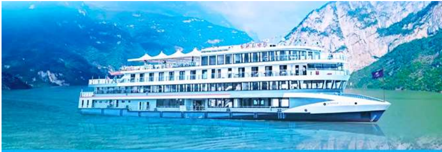
ล่องเรือชมเขื่อนสามผา