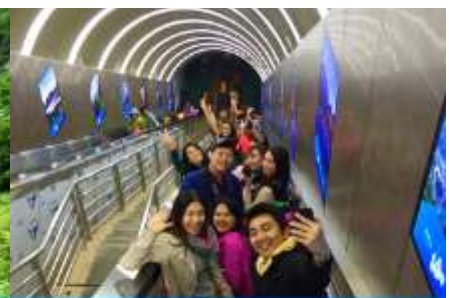
บันไดเลื่อนกะลุเกา