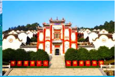
บ้านเกิดกวี ชวีหยวน