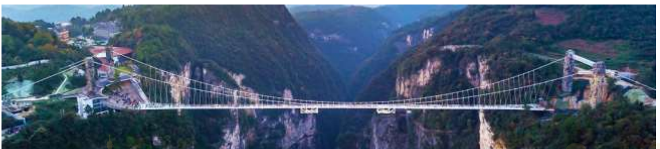
สะพานกระจกข้ามหุบเขาแกรนด์แคนยอน

หมายเหตุ การเลือกซื้อออฟชั่น ทางบริษัทขอสงวนสิทธิ์หากจำนวนผู้ซื้อไม่ถึง 15 ท่าน, ออฟชั่นนั้นไม่สามารถจัดให้ลูกค้าไปเที่ยวได้ จึงเรียนมาเพื่อให้ลูกค้าได้เข้าใจถูกต้องตรงกัน