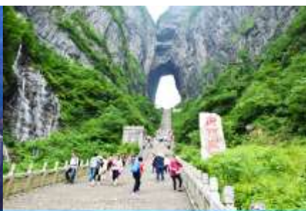
ประตูสวรรค์