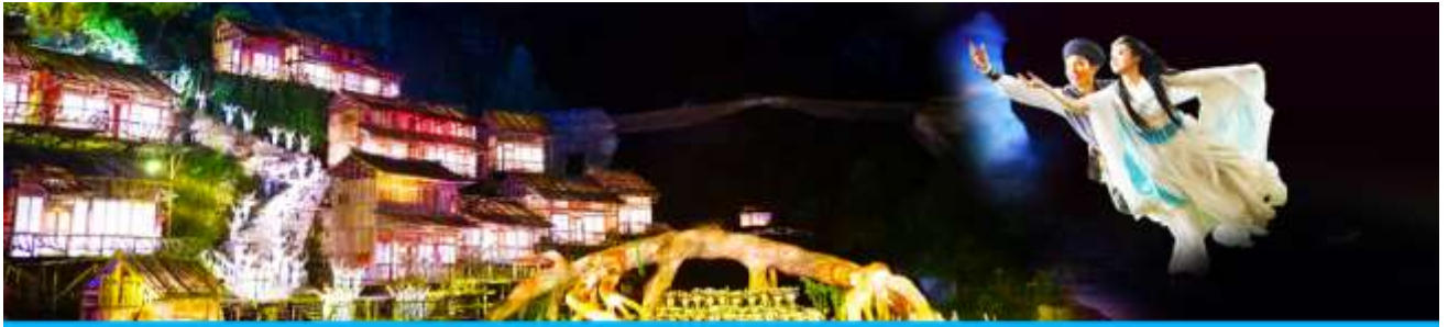
The Love Story of a Wooden Man and Fairy fox

หลังอาหารนำท่านเดินทางเข้าที่พัก หรือท่านสามารถเลือกซื้อโปรแกรมเสริม เป็นบัตรชมการแสดง ชุด The Love Story of a Wooden man and Fairy fox หรือที่เรียกกัน ในหมู่นักท่องเที่ยวไทยว่า โจวจิ้งจอกขาว เป็นการแสดงกลางแจ้งที่ทุ่มทุนสร้างอย่างสุดอลังการ เป็นการแสดงที่น่าดูชมที่สุดในเมืองจางเจียเจียะ การแสดงชุดนี้ใช้ภูเขาประตูล้อมรอบเป็นฉากหลังประกอบการแสดง ซึ่งให้ความรู้สึกสมจริงเสมือนผู้ชมและนักแสดงอยู่ท่ามกลางธรรมชาติ ใช้ทีมงานนักแสดงหลายร้อยคน และระบบแสง สี เสียงที่ทันสมัยประกอบการแสดง อัตราค่าบริการสำหรับโปรแกรมเสริมการแสดงชุด The love Story of Wooden man and Fairy Fox ท่านละ 400 หยวน (หรือ 2,000 บาทขึ้นอยู่กับอัตราแลกเปลี่ยน) ระยะเวลาที่ใช้ในการเที่ยวชมการแสดง ประมาณ 3 ชั่วโมง รวมเวลาเดินทางไป กลับค่าบริการรวม ค่าบัตรเข้าชม ค่ารถรับ ส่ง และค่าน้ำดื่มของโปรดท้องถิ่น