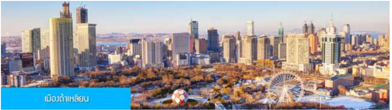
เมืองต้าเหลียน