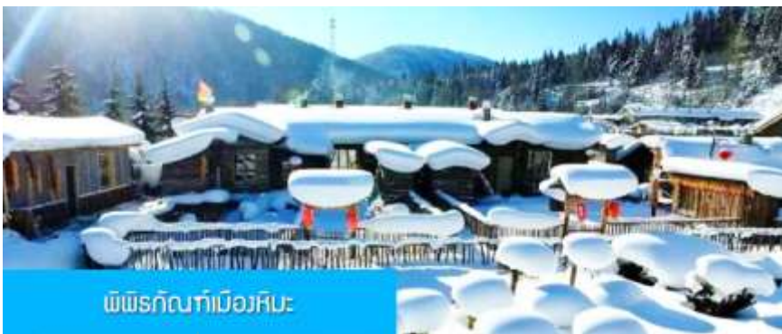
พิพิธภัณฑ์เมืองหิมะ

หมายเหตุ การไปพักในเมืองหิมะทางทัวร์ไม่สามารถจัดรถทัวร์ไปส่งลูกค้าถึงหน้าโฮมสเตย์ได้ ทางคณะต้องนั่งรถเมล์หมู่บ้านเข้าไป โดยลูกค้าต้องถือหรือลากกระเป๋าเข้าที่พักด้วยตัวเอง เพราะโฮมสเตย์จะไม่มีพนักงานยกกระเป๋า มาคอยบริการยกกระเป๋าให้ผู้เข้าพัก ท่านควรจัดเตรียมกระเป๋าใบเล็กที่บรรจุเสื้อผ้า และเครื่องใช้จำเป็นสำหรับการพักผ่อน ณ โฮมสเตย์ในเมืองหิมะในคืนนี้ เพื่อสะดวกต่อการเคลื่อนย้ายกระเป๋า, และภายในห้องพักจะไม่มีผ้าเช็ดตัวผืนใหญ่ จะมีเพียงสบู่ แชมพูบริการทุกโรงแรม ท่านควรเตรียมแปรงสีฟันยาสีฟันติดไปด้วย