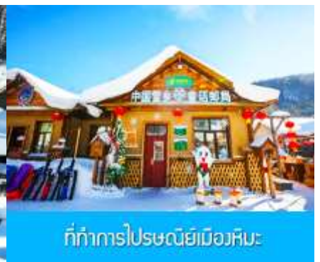
ที่ทำการประชณีย์เมืองหิมะ