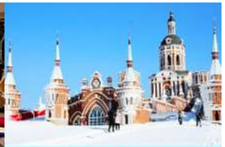
สวน LITTLE RUSSIA