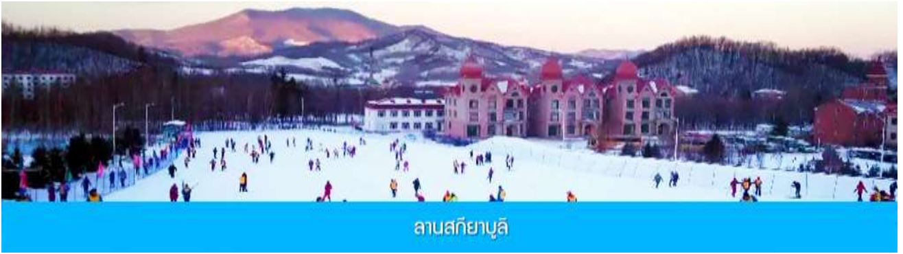
ลานสกียาบูลิ

วันที่สาม เมืองฮาร์บิน-ลานสกียาบูลิ-ชมการจับปลาฤดูหนาว-หมู่บ้านหิมะ Snow Town-ระเบียงชม วิวปังจฺยฺชาน-ถนน Xue Yun Da Jie