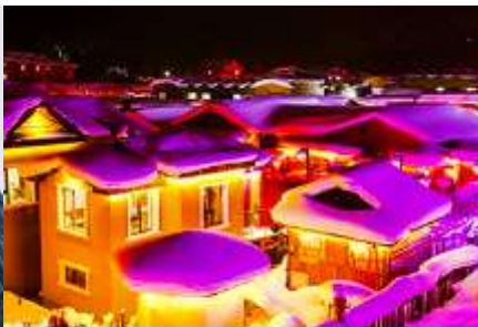
เมืองหิมะ Xue xiang