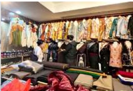
ศูนย์จำหน่ายอุปกรณ์กันหนาว