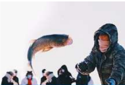
การจับปลาในฤดูหนาว

นำท่านชม การจับปลาในฤดูหนาว 冬捕 เป็นวิธีการจับปลาตามแม่น้ำและแหล่งน้ำในฤดูหนาวที่สืบทอดกันมาช้านาน โดยชาวบ้านจะนำแหดักปลามาวางดักไว้ตามจุดต่าง ๆ ก่อนที่ผิวน้ำจะปกคลุมด้วยน้ำแข็ง หลังจากผิวน้ำกลายเป็นน้ำแข็งแล้ว ชาวบ้านจะเจาะพื้นน้ำแข็งบริเวณที่มาแหวางดักอยู่เพื่อยกแหขึ้น จะมีปลาติดแหเป็นจำนวนมาก...พิเศษ ให้ท่านได้ชมการยกแหดักปลาจากสถานที่จริง และให้ท่านได้ชิมซุปรเนื้อปลาสด ๆ ที่ได้จากแหดักปลา