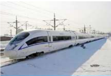
รถไฟความเร็วสูง