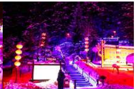
ระเบียงชมวิว ปังจฺยฺชาน