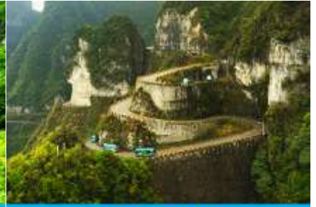
เส้นทาง 99 ขั้น