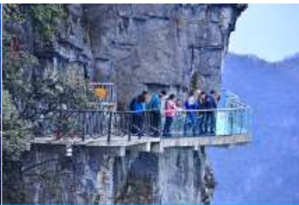
หน้าผาลอยฟ้าทางเดินกระจก