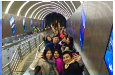
บันไดเลื่อนทะเลภูเขา