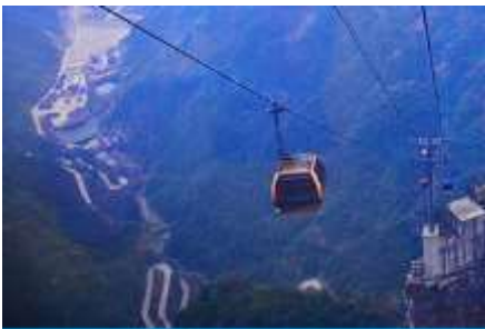
กระเช้าขึ้นเทียนเหมินซาน

https://hk.trip.com/hotels/guzhang-hotel-detail-68614854/chaxitai-holiday-hotel/