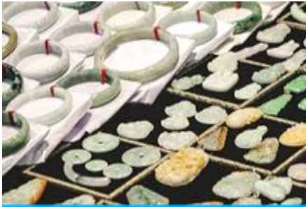
ศูนย์จำหน่ายผลิตภัณฑ์หอยก