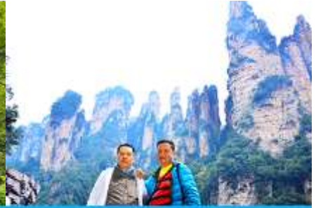
ชมจุดชมวิวลีฟท์แก้ว