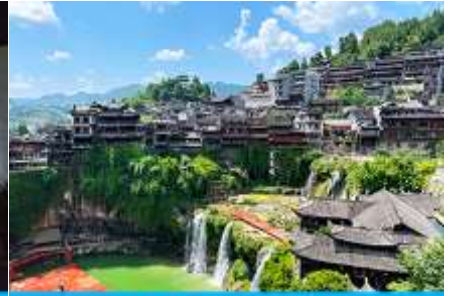
เมืองโบราณฝูหรงเก๋น