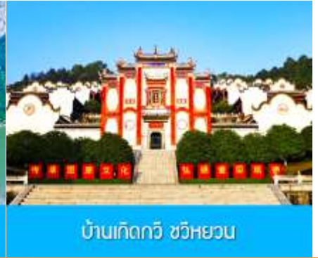
บ้านเกิดกวี ขวี่หยวน