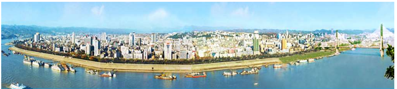
เมืองหยีซัง

-ไม่เก็บทิปก่อนเที่ยว เพราะมั่นใจในคุณภาพ