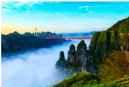
อุทยานป่าไม้แห่งชาติไ่อ๋จ้าย