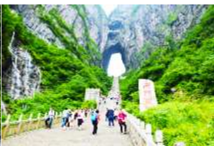
บันได 999 ขั้น