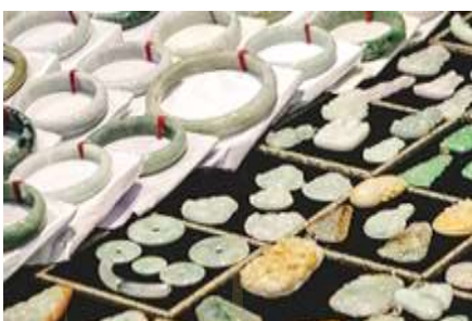
ศูนย์จำหน่ายผลิตภัณฑท์หยก

พักที่ ZHENMIAN HOTEL โรงแรมระดับ 4 ดาวหรือเทียบเท่า