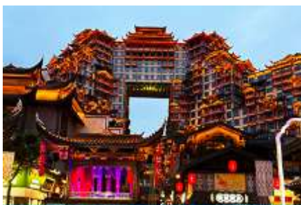
ตึกมหาเศรษฐี 72 ชั้น

พักที่ CHANGDE YUNXI HOTEL ระดับ 4 ดาวท้องถิ่น หรือเทียบเท่าในเมืองฉางเต๋อ