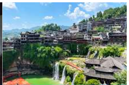
เมืองโบราณฟูหวงเจิน