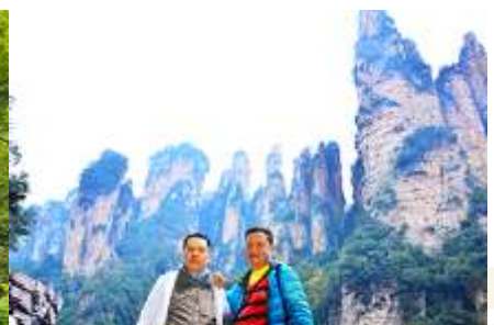
ชมจุดชมวิวลีฟักแก้ว