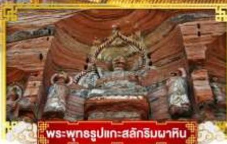
พระพุทธรูปแกะสลักหินผาคิน