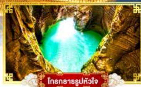
โครงการรูปหัวใจ