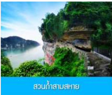
สวนถ้ำสามสหาย