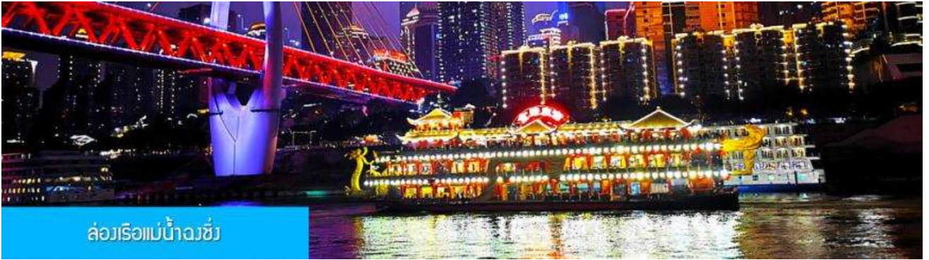
ล่องเรือแม่น้ำฉงชิ่ง

พักที่ HAITANGLIZHI HOTEL โรงแรมระดับ 4 ดาวหรือเทียบเท่าในเมืองฉงชิ่ง