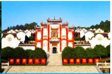
บ้านเกิดกวี ขิวหยวน