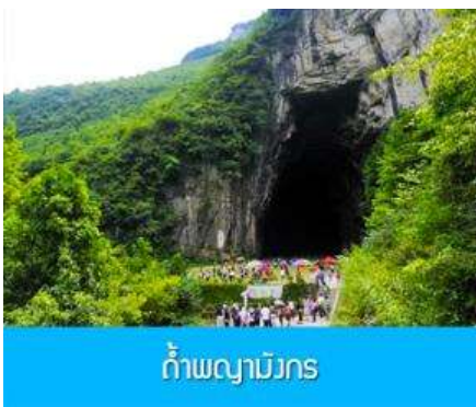
ถ้ำพญามังกร

พักที่ VIENNA HOTEL โรงแรมระดับ 4 ดาวหรือเทียบเท่าในเมืองเินซือ