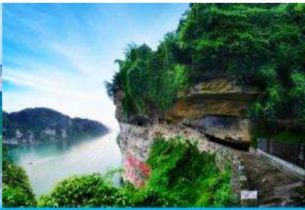
สวนถ้ำสามสหาย