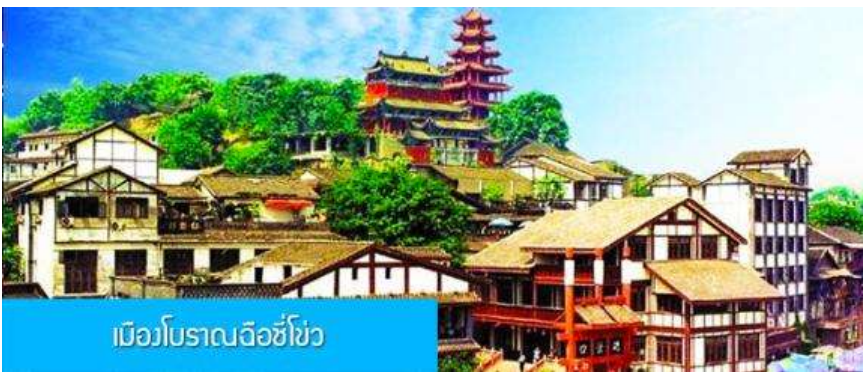
เมืองโบราณฉือชิว

OPTIONAL TOUR ไกด์นำเสนอโปรแกรมล่องเรือ ชมความสวยงามสองริมฝั่งแม่น้ำของมหานครฉงชิ่ง ท่านละ 280 หยวน หรือ 1,400 บาท