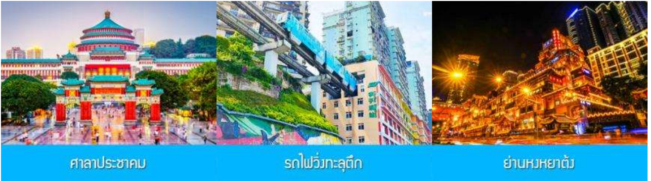
ศาลาประชาชน