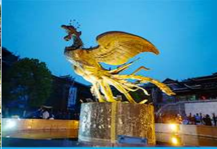
เมืองโบราณฟ่งหวง