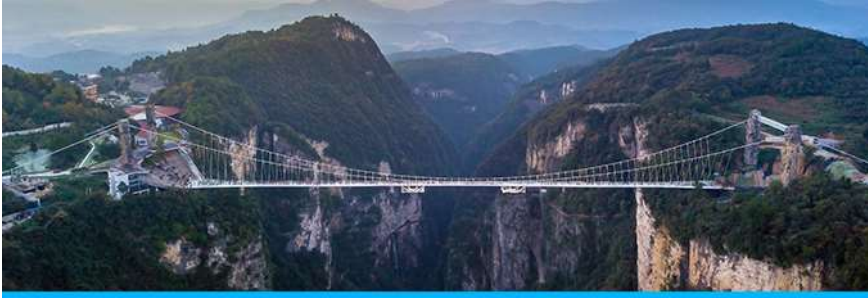
สะพานกระจกเวียงเจี๋ย