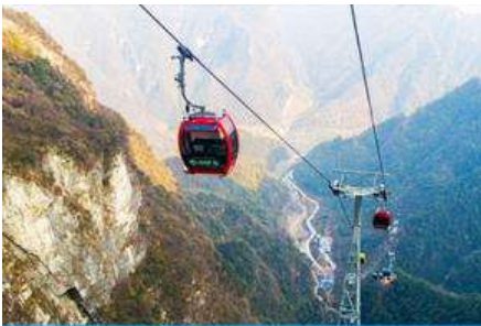
กระเช้าขึ้น/ลงเขาจิ๋นถาว

โรงแรมระดับ 4 ดาวท้องถิ่นหรือเทียบเท่าในเมืองฟงหวง