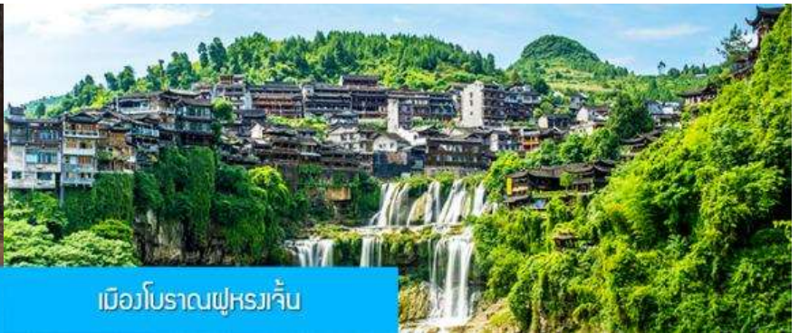
เมืองโบราณฝูหรงเจิ้น