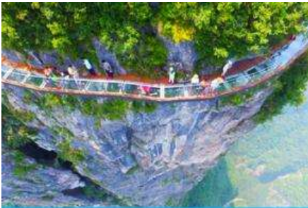
ระเบียงกระจกเลียบนหน้าผาไฉ่จ้าย