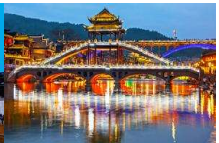
สะพานหงเจียว