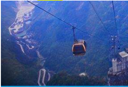
กระเช้าขึ้นเขียบเหมินซาน

อัตราค่าบริการสำหรับโปรแกรมเสริมการแสดงชุด The love Story of Wooden man and Fairy Fox ท่านละ 400 หยวน (หรือประมาณ 2000.-บาทขึ้นอยู่กับอัตราแลกเปลี่ยน) ระยะเวลาที่ใช้ในการเที่ยวชมการแสดง ประมาณ 3 ชั่วโมง รวมเวลาเดินทางไป กลับค่าบริการรวม ค่าบัตรเข้าชม ค่ารถรับ ส่ง และค่าน้ำดื่มของไกด์ท้องถิ่น