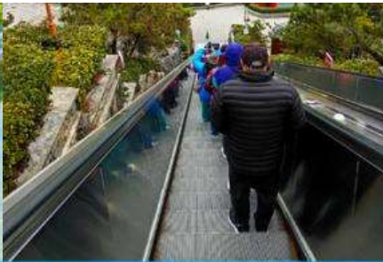
บันไดเลื่อนจากยอดเขาอุทยานไฉ่จ้าย