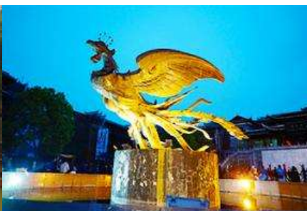
จัตุรัสหงส์