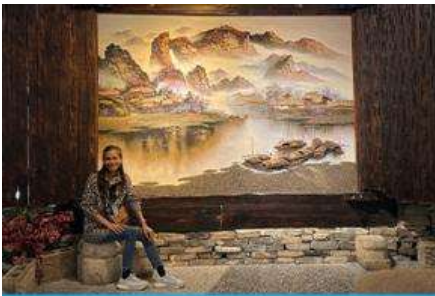
พิพิธภัณฑ์ภาพเขียนหินทราย

พักที่ YICHANG MEIJI BOYUE HOTEL โรงแรมระดับ 4 ดาวหรือเทียบเท่าในเมืองจางเจียเจี๋ย