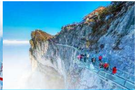
ระเบียงทางเดินกระจากเลียบบหน้าผา