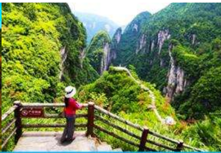
แท่น ปู่จางสวรรค์