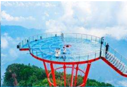
ระเบียงชมวิว Sky Eye