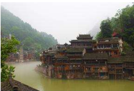
เมืองโบราณฝงหวง