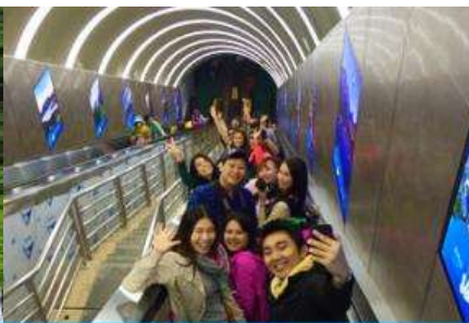
บันไดเลื่อนทะลุภูเขา