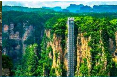
ลิฟท์แก้วอุทยานไฉ่จ้าย

นำท่านเดินผ่าน ระเบียงกระจกเลียบนหน้าผา ที่มีความสูงจากพื้นล่างถึง 300 เมตร นำท่านเดินผ่าน บันไดเลื่อน จากยอดเขาลงไปยังตัวสะพาน ไฉ่จ้ายต้าเจียว 矮寨大桥 ซึ่งเป็นสะพานแขวนข้ามหุบเขาที่เป็นสะพานค้อมหุบเขาที่ยาวที่สุดในโลก นำท่านโดยสาร ลิฟท์แก้วชมวิ ที่สร้างอยู่ริมหน้าผาและท่านจะได้เห็นความสวยงามอย่างมหัศจรรย์ของธรรมชาติ...เมื่อเสร็จจากการเที่ยวชม จุดท่องเที่ยวต่าง ๆ ในอุทยานแล้ว นำท่านนั่งรถกอล์ฟมายังลานจอดรถ