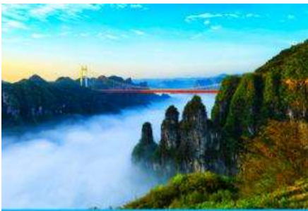
อุทยานป่าไม้แห่งชาติไฉ่จ้าย