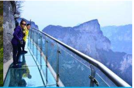
หน้าพาลอยฟ้าทางเดินกระจก

วันที่หก เมืองจางเจียเจีย – เลือกซื้อโปรแกรมเสริม OPTIONAL TOUR แพคเกจเที่ยวภูเขาเทียนเหมินซาน – ร้านหยก-ร้านใบชา – เดินทางกลับเมืองหยีซัง