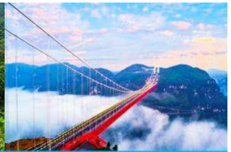
สะพาน ไฉ่จ้ายต้าเจียว