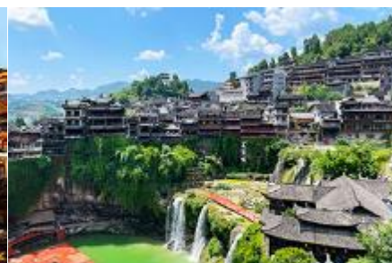
เมืองโบราณผู่หรงจิ้น