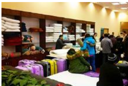
ศูนย์จำหน่ายผลิตภัณฑ์ยางพารา

พักที่ ZHENMIAN HOTEL OR YINXIANG HOTEL ระดับ 4 ดาวท้องถิ่นหรือเทียบเท่าในเมืองจางเจียเจี๋ย