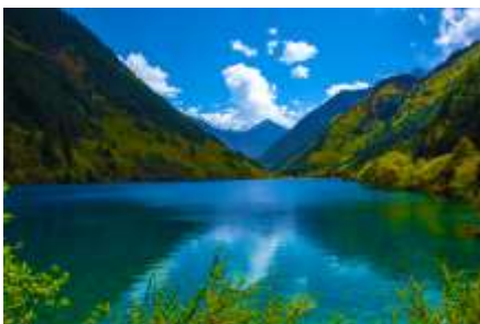
ทะเลสาบไธรา (RHINO LAKE)

หลังอาหารเช้าท่านเดินทางสู่ อุทยานแห่งชาติจิวจ้ายโกว 九寨沟景区 ตั้งอยู่ด้านทิศเหนือของมณฑลเสฉวน ซึ่งเป็นส่วนหนึ่งในบริเวณตอนใต้ของเทือกเขาหิมิงซาน ห่างออกไปจากตัวเมืองเฉิงตูราว 500 กิโลเมตร จิวจ้ายโกวมีชื่อเสียงด้านความงามแห่งสีสันที่แปลกเปลี่ยนไม่รู้จบ ทะเลสาบผุดขึ้นท่ามกลางหมู่แมกไม้เขียวขจี น้ำใสเป็นประกายชุ่มฉ่ำ ยอดเขาหิมะตัดกับท้องฟ้าสีคราม เกิดเป็นภาพธรรมชาติอันงดงามที่แปรเปลี่ยนไปตามฤดูกาลผลิ ด้วยความสวยงามจึงทำให้อุทยานแห่งชาติจิวจ้ายโกว ได้ถูกขึ้นทะเบียนเป็นมรดกโลกทางธรรมชาติในปีค.ศ. 1992