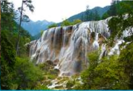
น้ำตกธารไข่มุก