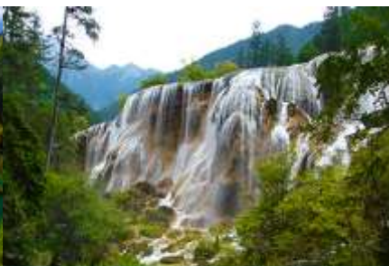
น้ำตกธารไข่มุก