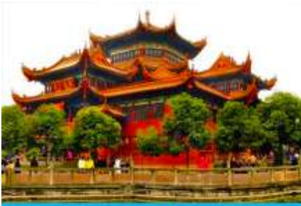
วัดเจาเจีย