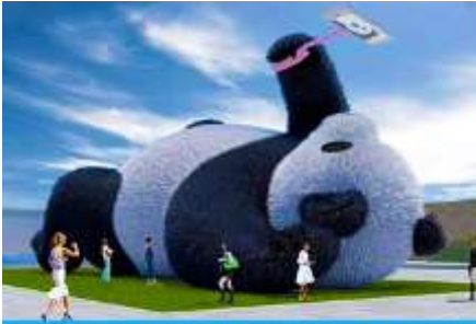
ตุ๊กตาแพนด้านอนเซลฟี