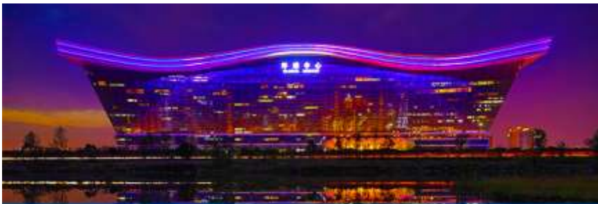
Chengdu new century global center