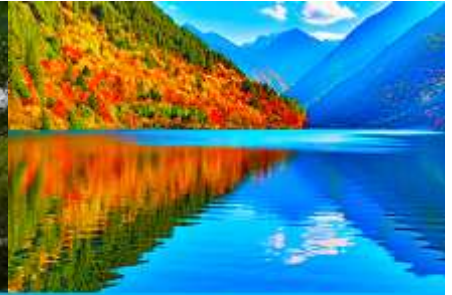
ทะเลสาบแพนด้า