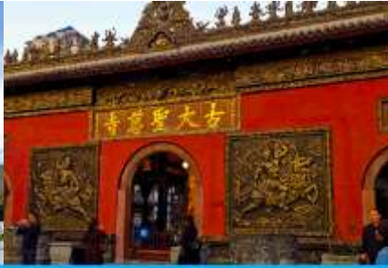
วัดต้าเจี๋ย