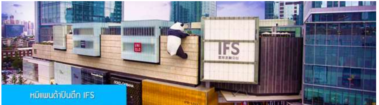
หมีแพนด้าปีนตึก IFS