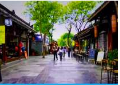
ชอยกว้าง ชอยแคบ และชอยบ่อน้ำ

วันที่หก เมืองเฉิงตู – วัดเจาเจีย- ถนนโบราณจินหลี่-ชอยกว้างชอยแคบ-SPK Global Center – ชมแสงสีบน ตึกแฝด – เดินทางกลับกรุงเทพฯ