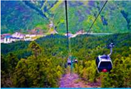
นั่งกระเช้าขึ้นสู่อุทยานหวงหลง