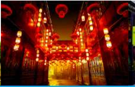
ถนนโบราณสกาบ่วหลี่