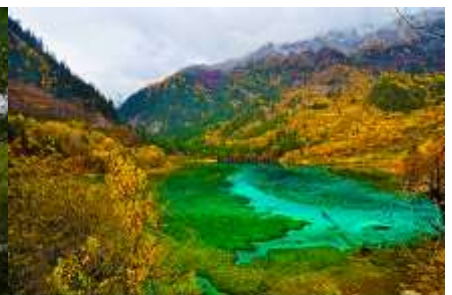
ทะเลสาบนกยูง (PEACOCK LAKE)