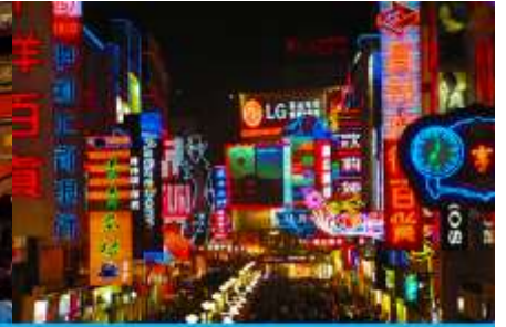
ถนนคนเดินชุนซีลู่