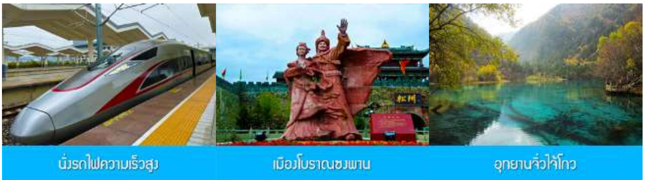
นักรถไฟความเร็วสูง