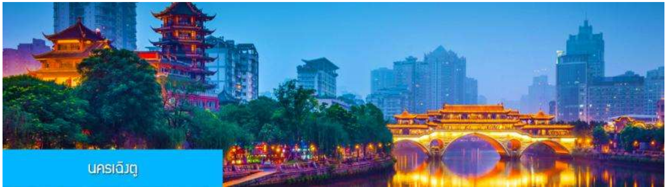
นครเฉิงตู