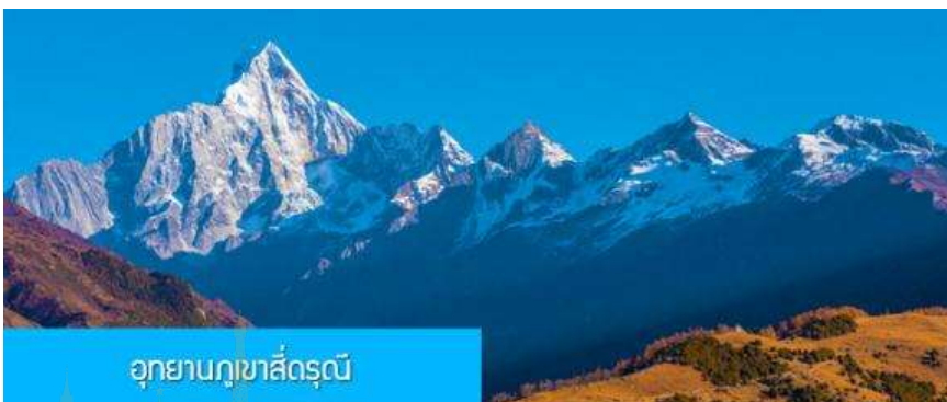
อุทยานภูเขาสี่ครุณี

หลังอาหารนำท่านเที่ยวชม หุบเขาซวงเฉียวโกว 双桥沟景区 ที่เป็นแหล่งท่องเที่ยวที่สวยงามที่สุดแห่งหนึ่งในเขตอุทยานภูเขาสี่ครุณี นำท่านนั่งรถบัสของอุทยานที่วิ่งไปผ่านเส้นทางทิวทัศน์ที่สวยงามกับลำธารกษยในหุบเขา ท่านจะได้สัมผัสกับความสวยงามของทัศนียภาพธรรมชาติที่หาชมได้ยาก โดยมีภูเขาหิมะสูงตระหง่านอยู่เบื้องหลัง ธารน้ำใสไหลริน และสระน้ำที่มีสีเขียวมรกต ในฤดูใบไม้ผลิและฤดูร้อนท่านจะได้เห็นฝูงจามรีท่ามกลางทุ่งหญ้าเขียวจี ส่วนในฤดูหนาวทุ่งหญ้าและพื้นดินจะปกคลุมด้วยพรมหิมะสีขาว....รถบัสของอุทยานจะนำนักท่องเที่ยวไปยังจุดชมวิวสำคัญต่าง ๆ ภายในเขตอุทยาน เพื่อให้นักท่องเที่ยวได้เที่ยวชมสถานที่และถ่ายรูปตามอัธยาศัย จนครบแ่เวลา นำคณะขึ้นรถบัสออกจากอุทยาน