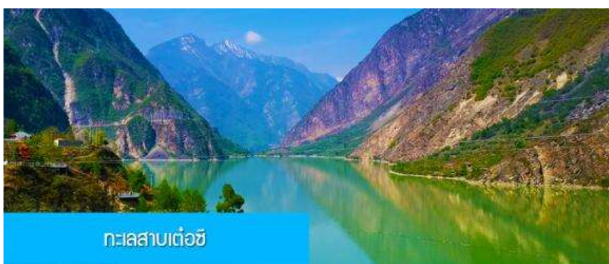
ทะเลสาบเต๋อซี

พักที่ MINJIANG HOTEL 5* หรือ โรงแรมระดับ 5 ดาวท้องถิ่น