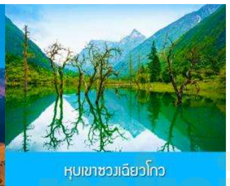
หุบเขาซวงเฉียวโกว