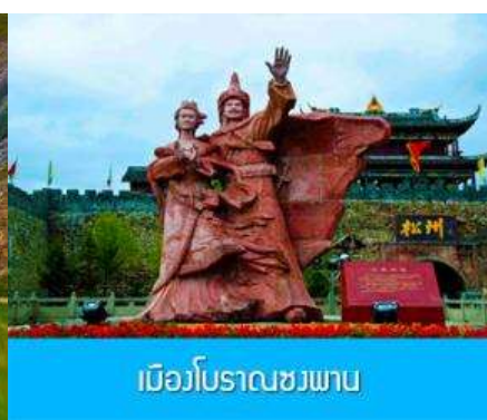
เมืองโบราณชวงพาน

วันที่ เมืองชวณจู่ซือ – ทะเลสาบเต๋อซี-อุทยานภูเขาตี้ครุณี-ผ่านชมวิวกุเขาที่ราบสูง