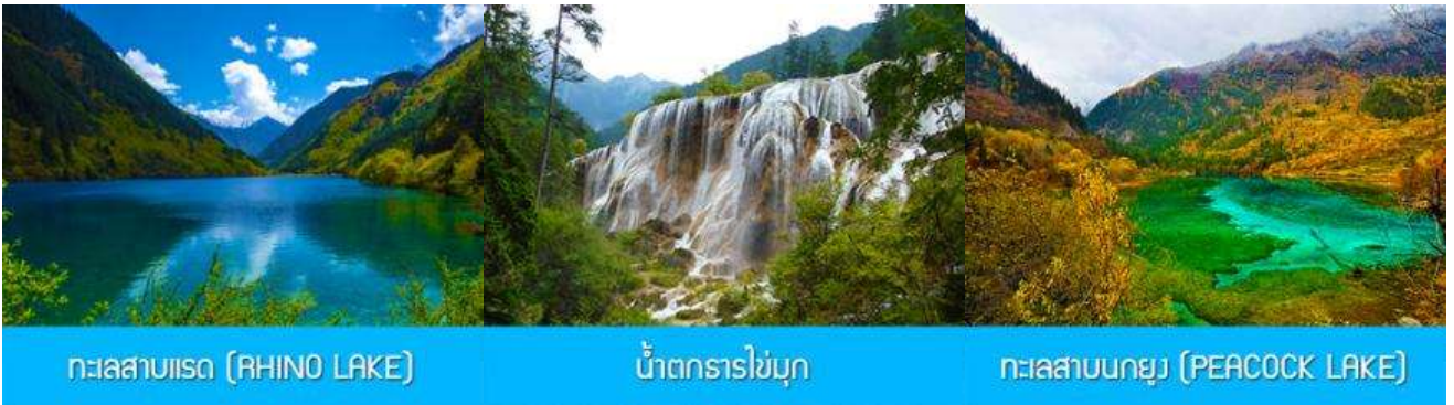
ทะเลสาบแรด (RHINO LAKE)

ฤดูกาลผลิ ด้วยความสวยงามจึงทำให้อูทยานแห่งชาติจิวจ้ายโกว ได้ถูกขึ้นทะเบียนเป็นมรดกโลกทางธรรมชาติ ในปี.ศ. 1992