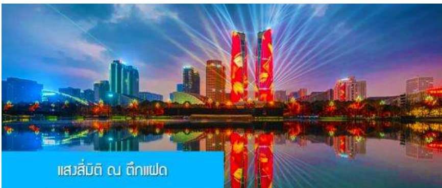
แสรมิตี ณ ตึกแฝด