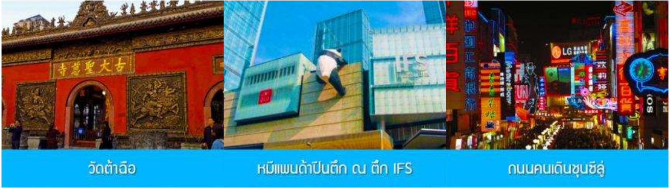
วัดต้าเว็อ