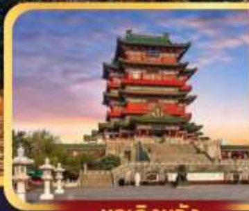
หอเกิ่งหวัง