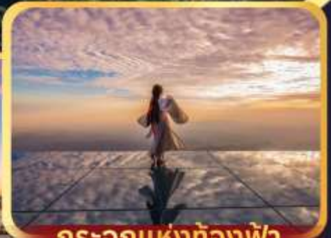
กระเจกแห่งท้องฟ้า