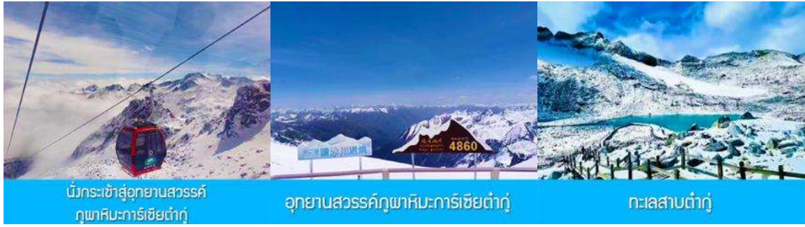
บันไดกระเช้าสู่อุทยานสวรรค์ ภูผาหิมะการ์เซียต้ากู่