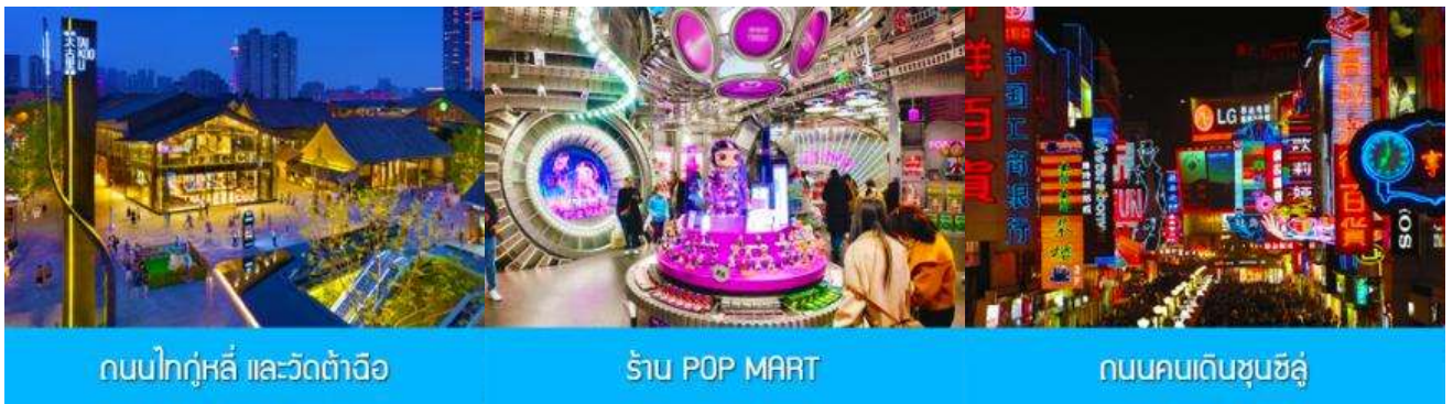
ถนนไท่กุ่หลี่ และวัดต้าฉือ

พักที่ โรงแรม SERENGETI HOTEL ระดับ4 ดาวท้องถิ่นหรือเทียบเท่า