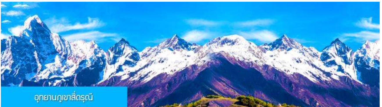
อุทยานภูเขาสีดรุณี

พักที่ DAGU GLACIER HOTEL 4* หรือ โรงแรมระดับเดียวกันพื้นเมือง