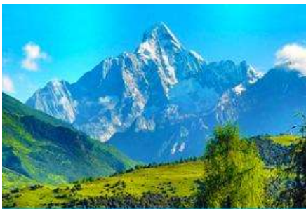
อุทยานภูเขาสี่ตรุณี

พักที่ SI GUNIANG SHAN HOTEL 4* หรือระดับ4ดาวพื้นเมือง