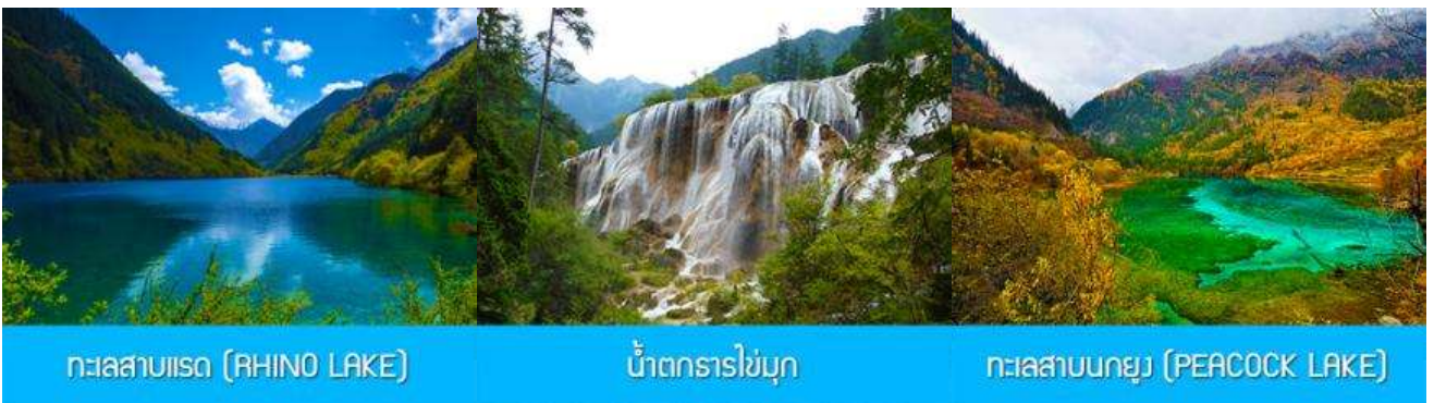
ทะเลสาบโอสถ (RHINO LAKE)

หลังอาหารเช้านำท่านเดินทางสู่ อุทยานแห่งชาติจิวจ้ายโกว 九寨沟景区 ตั้งอยู่ด้านทิศเหนือของมณฑลเสฉวน ซึ่งเป็นส่วนหนึ่งในบริเวณตอนใต้ของเทือกเขาหิมิงซาน ห่างออกไปจากตัวเมืองเจิ้งตูราว 500 กิโลเมตร จิวจ้ายโกวมีชื่อเสียงด้านความงามแห่งสีสันที่แปลกเปลี่ยนไม่รู้จบ ทะเลสาบผุดขึ้นท่ามกลางหมอกแม่ไม้เขียวขจี น้ำใสเป็นประกายชุ่มฉ่ำ ยอดเขาหิมะตัดกับท้องฟ้าสีคราม เกิดเป็นภาพธรรมชาติอันงดงามที่แปรเปลี่ยนไปตามฤดูกาลผล ด้วยความสวยงามจึงทำให้อุทยานแห่งชาติจิวจ้ายโกว ได้ถูกขึ้นทะเบียนเป็นมรดกโลกทางธรรมชาติ ในปีค.ศ. 1992