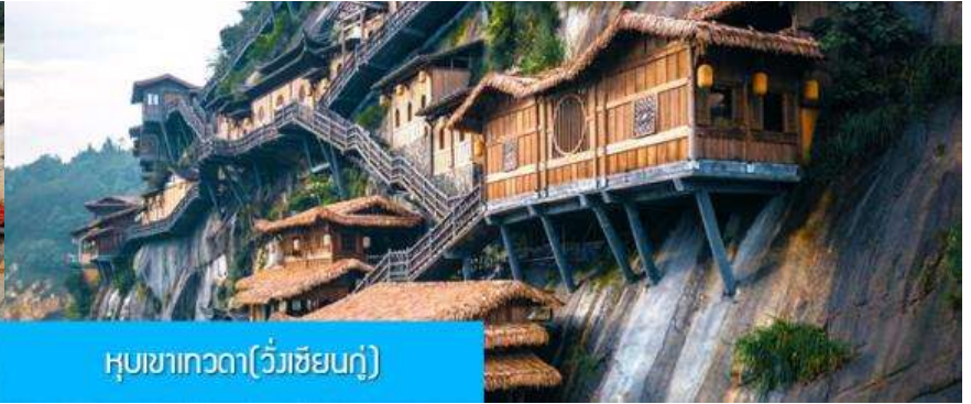
หุบเขาเทวดา(วังเซียนกู่)