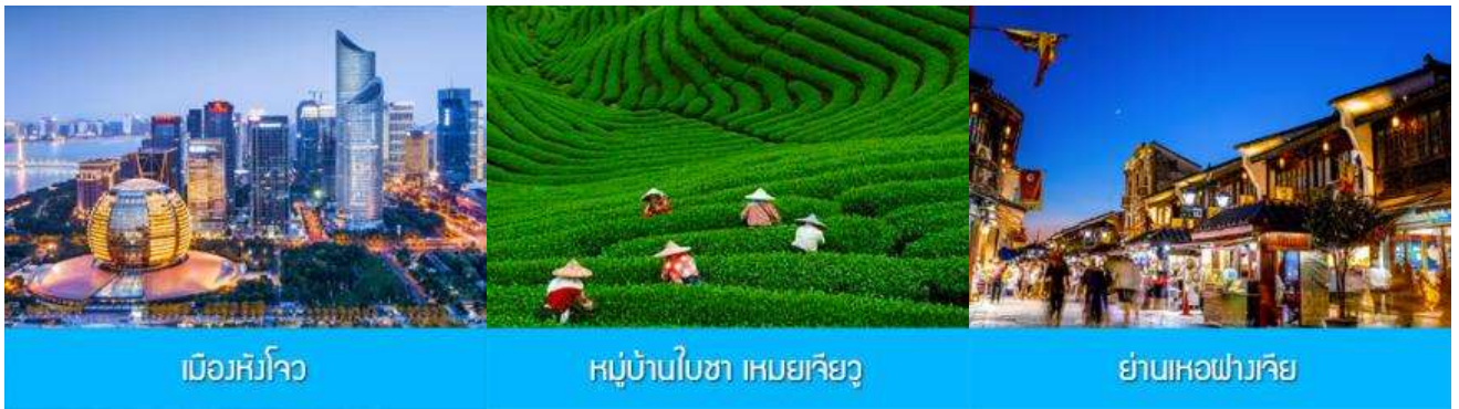
เมืองหังโจว

พักที่ โรงแรม JIANGNAN HAOTING HOTEL ระดับ 4 ดาวห้องถ้ำหรือเทียบเท่าในเมืองซ่งเหลา