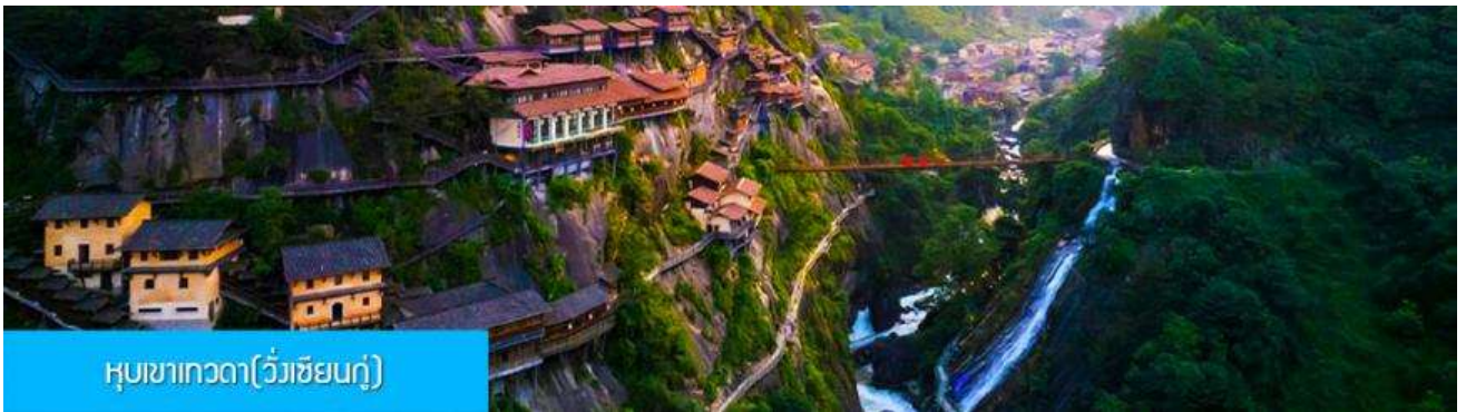
หุบเขาเทวดา(วังเซียนกู่)