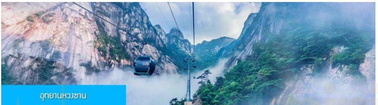
อุทยานหวงซาน

หลังอาหารเช้าท่านให้ท่าน อิสระพักผ่อนตามอัธยาศัยใน โรงแรมที่พัก