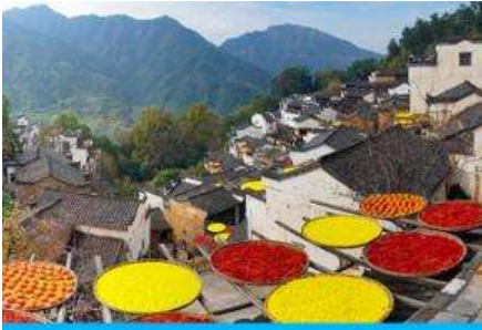
หมู่บ้านโบราณหวงหลิ่ง

พักที่ WANCHUAN HOTEL โรงแรมระดับ 4 ดาวท้องถิ่น หรือเทียบเท่า ในอุทยาน วู่หนี่โจว