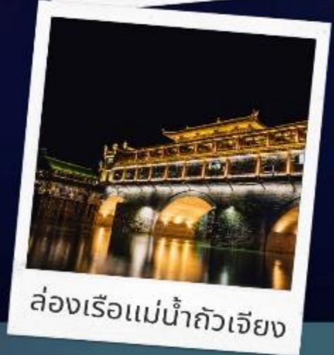
ล่องเรือแม่น้ำถั่วเจียง