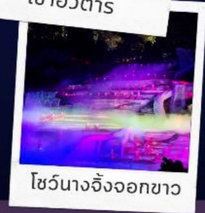
โซว์นางจิ้งจอกขาว