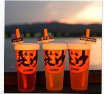
เซียงเจียงริเวอร์ไซด์