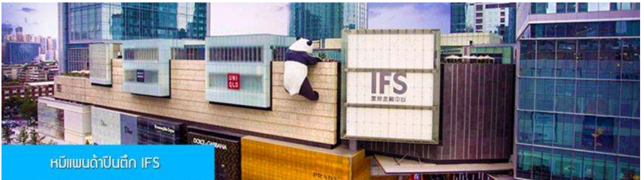
หมีแพนด้าปีนตึก IFS