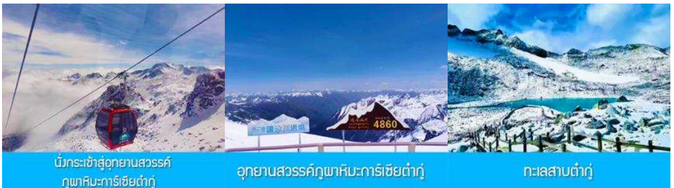
บันไดกระเช้าสู่อุทยานสวรรค์ ภูเขาคิมะการ์เซียต้ากู่

หมายเหตุ : การท่องเที่ยวภายในอุทยานนั้นไกด์และหัวหน้าทัวร์ จะใช้วิจารณญาณในการนำท่านเดินทางท่องเที่ยวตามจุดชมวิวดังต่าง ๆ ภายในอุทยาน ซึ่งจะพยายามไปเที่ยวให้ได้มากที่สุด เท่าที่สามารถทำได้ ทั้งนี้ขึ้นอยู่กับการใช้เวลาในแต่ละสถานที่ และความร่วมมือในการรักษาเวลาของคณะทัวร์ และสภาพอากาศในวันนั้นๆ ณ วันเดินทาง หากคณะไม่สามารถเดินทางไปชมอุทยานจิวจ้ายโกวได้ ไม่ว่าจะเนื่องจากสภาพอากาศ หรือเหตุผลใดๆ ทางบริษัทขอสงวนสิทธิ์ในการเปลี่ยนสถานที่ท่องเที่ยวเป็น “อุทยานแห่งชาติชงผิงโกว” และ/หรือสถานที่เที่ยวอื่นแทน ค่า รับประทานอาหารค่ำ ณ ภัตตาคาร พักที่ YARI INTER HOTEL 4* หรือ โรงแรมระดับเดียวกันท้องถิ่น