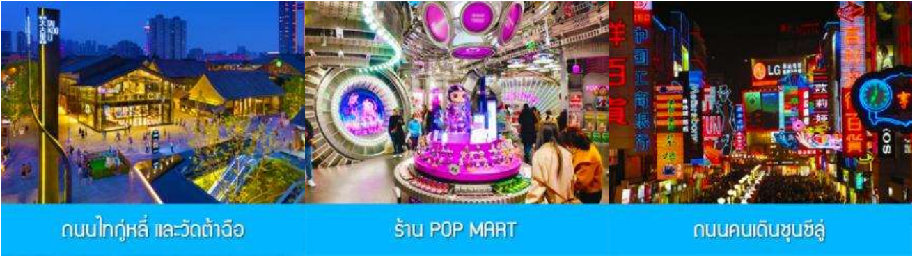
ถนนไท่กู่หลี่ และวัดต้าเจี๋ย