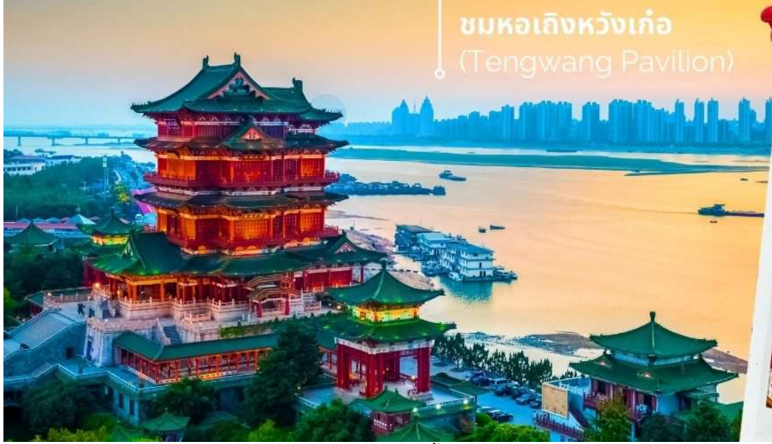
ชมหอเถิงหวังเก้อ (Tengwang Pavilion)

ออกเดินทาง สู่เมืองหนานซาง โดยใช้เวลาเดินทางประมาณ 4-5 ชั่วโมง ชมหอเถิงหวังเก้อ (ถ่ายรูปด้านนอก) เถิงหวางเก้อตั้งอยู่ที่ริมแม่น้ำกานเจียงเริ่มสร้างเมื่อปี ค.ศ.635 สมัยราชวงศ์ถัง โดย ลี ยวนยิง น้องชายของจักรพรรดิ