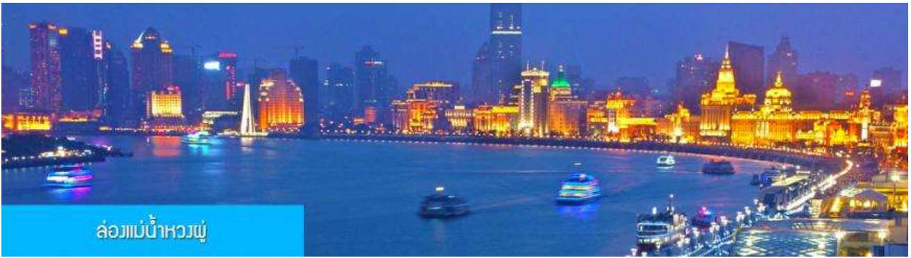
ล่องแม่น้ำหวงผู่

พักที่ โรงแรม Heyi Hotel or Holiday Inn Express Hotel 4* หรือเทียบเท่าในเมืองเซี่ยงไฮ้