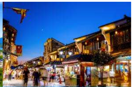
ย่านเหอฝางเจีย