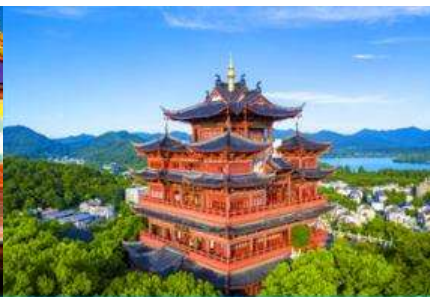
หอเจิงหวงเก้อ