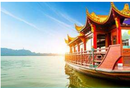
ล่องเรือทะเลสาบซีหู

พักที่ โรงแรม Heyi Hotel or Holiday Inn Express Hotel 4* หรือเทียบเท่าในเมืองเซี่ยงไฮ้