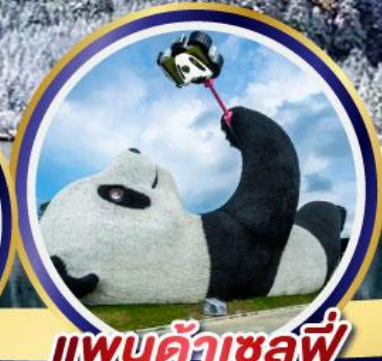
แพนด้าเซลฟ์