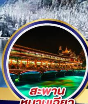
สะพาน หนานเจียว