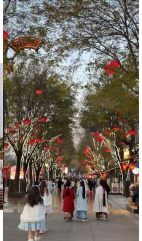
พิเศษ !! ให้ท่านได้

ถ่ายรูป เดินเล่น ในชุดพอส.จีน ซึ่งเป็นที่นิยมมากในเมืองซีอาน (ไม่รวมค่าชุดและค่าถ่ายรูปประมาณ 500-1000บาท)