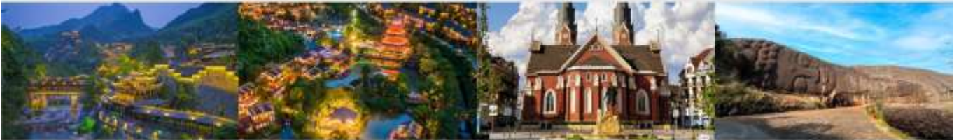
หุบเขาเทวดาวังเซียนกู่