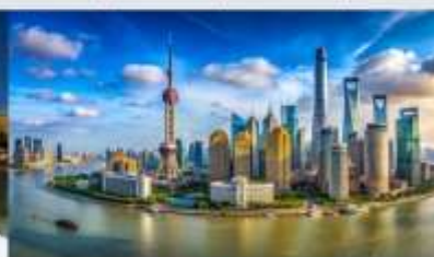
หาดไว่กาน