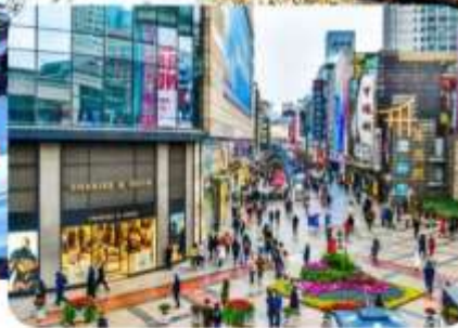
ถนนคนเดินสุขุมวิท