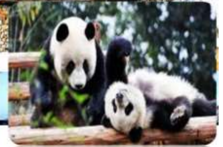
สวนสัตว์จี้หนี่แพนด้า

เมนูพิเศษ สุกี้หม่าล่า บุฟเฟ่ต์ / เปิดปิกนิก